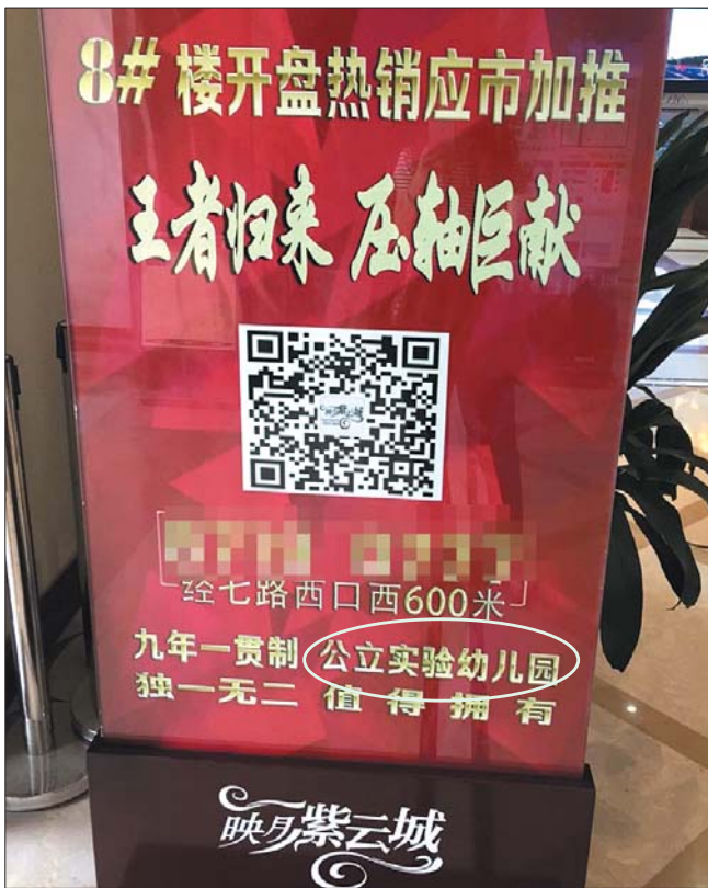
开发商当时的宣传海报上标明的是“公立幼儿园”。