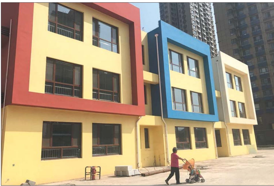
幼儿园为一座三层楼，楼体已完工。