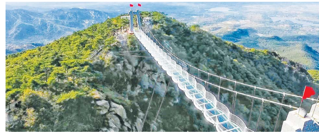
沂蒙山龟蒙景区3D玻璃桥