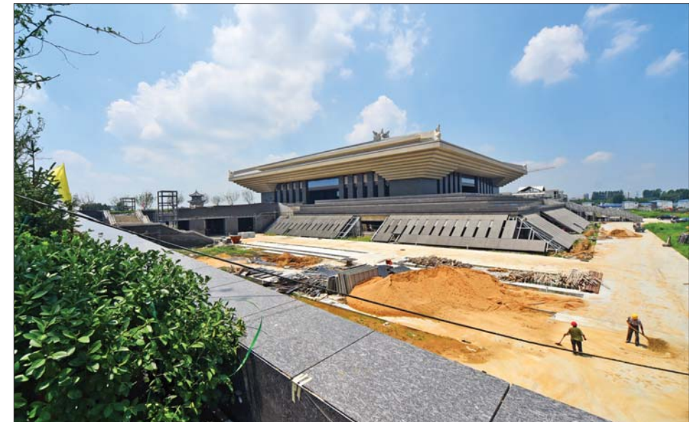
正在建设中的孔子博物馆。

孔子博物馆建设正紧张有序地进行中。目前孔子博物馆的主馆结顶已经进入内装修阶段，同时室外景观也在施工中，今年底将基本建成。同时，馆内展陈方案也已确定，孔子博物馆展陈将由“孔子的时代、孔子的一生、孔子的智慧、孔子与中华文明、孔子与世界文明、永远的孔子”六大部分构成。