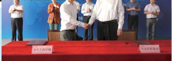
2016年5月，鲁泰控股集团与海尔集团上海乐赚公司签订互联网金融全面战略合作协议。2016年11月5日，全国首家石墨烯高分子复合材料研发中心在山东鲁泰控股集团建成启用。