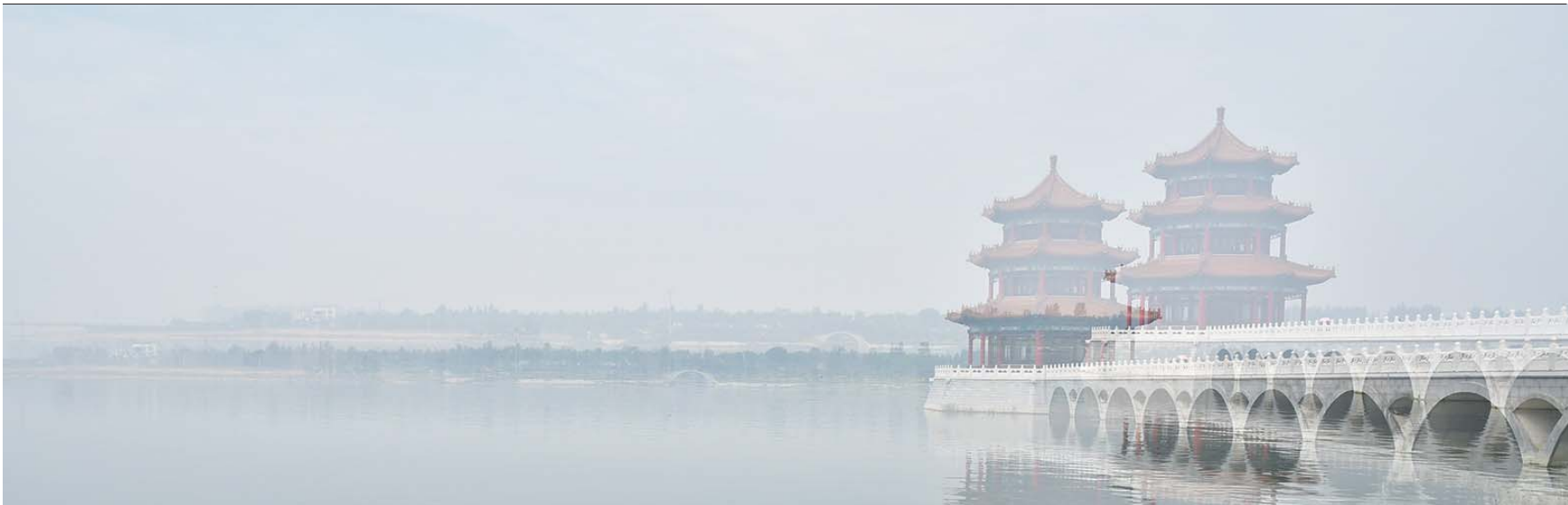
影影绰绰,虚虚实实的天颐阁。