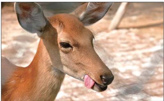
高贵调皮的小鹿。