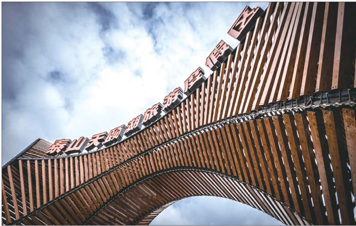
蓝天下气势恢宏的天颐湖正大门。