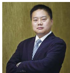
GOME 国美 D 大中电器

华硕是电脑数位科技领域的领导品牌,依靠强大的科研制造行销实力,目前已形成包括笔记本电脑、平板电脑、智能手机、一体机、主板、显卡、路由器、穿戴设备等在内的完整产品线,积极布局未来移动云端时代,是最年轻的世界500强企业之一。社会公益方面,华硕携手中国科协在全国次发达地区建起了1061座“华硕科普图书室”,累计投入价值5000多万元的科普书籍和电脑设备。在未来,华硕在山东将继续以磐石般的坚韧品质,书写企业新的篇章!