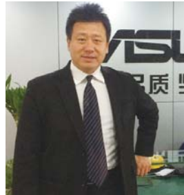
ASUS 华硕品质·坚若磐石

海纳百川,信诚无限,海信用专注及匠人的情怀,保持着企业的稳健发展,以高质量的产品服务广大消费者。双节来临之际,海信济南营销中心祝广大消费者生活幸福,和气满堂,阖家欢乐!