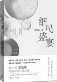
《细民盛宴》 张怡微 著 人民文学出版社