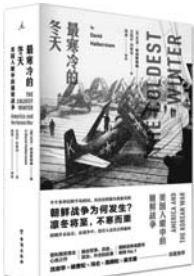
《最寒冷的冬天》 大卫·哈伯斯塔姆 著 台海出版社