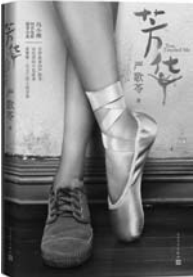
《芳华》 严歌苓 著 人民文学出版社

上海八零后女作家、王安忆的亲授女弟子张怡微,近年来着力于写作“家族试验”系列故事,今年年初出版的《细民盛宴》为其中唯一一部长篇。受王安忆的影响,张怡微的落笔之处不在于人的情感,而是“无事”的家庭日常背后,种种的琐碎磨折、微细悲哀,以及所谓团圆美满下的破损真相。故事从少女袁佳乔在爷爷的葬礼上第一次见到继母开始,从此延展出一段复杂的人情往事。在与继父、继母、继母之子、公婆等心酸复杂的相处中,袁佳乔不断以自卫和偏见抵御着人情冷暖的考验。面对复杂的家族关系,她痛苦而顽强地坚守着最初对于原生家庭的爱。在对生父、生母的情感旅程中,袁佳乔一再期望又失望,也找不到家庭瓦解后自己恰当的位置。历经了一场又一场或悲或喜的家族盛宴,她蓦然回首时发现,漫长的成长中不期然的点滴,才是生活最真实的原相。