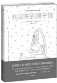
《欢迎来到猴子馆》 库尔特·冯内古特 著 中信出版集团

每逢朝鲜半岛局势紧张,人们都会联想起 67 年前发生的那场战争。前《纽约时报》记者兼普利策奖得主大卫·哈伯斯塔姆,以剖析美国卷入越战的巨著《出类拔萃的一代》而享誉知识界。写作时,他发现美国介入越战的根源,乃是朝鲜战争,于是先后走访了诸多知名图书馆和研究机构,访问了 100 多位散布美国各个角落的朝鲜战争幸存老兵,耗时 10 余年时间,撰写完成了美国介入朝鲜战争的历史——《最寒冷的冬天》。在这本书写完不久,哈