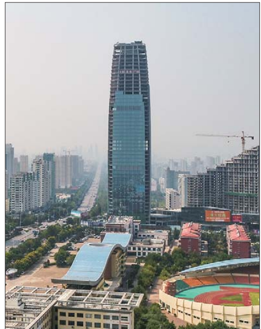
正在建设中的日照第一高楼是206米的安泰国际广场。