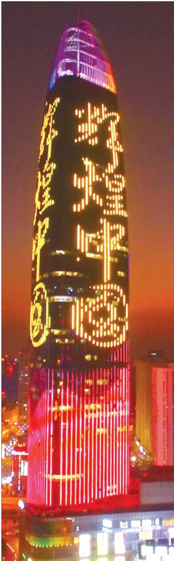
济南目前的第一高济南绿地普利中心为303米。

随着城市化进程的不断推进,城市“向上”发展是一种趋势。从1998年山东最高的213米到目前的420米,将近20年的时间,山东最高楼层已经长高了200余米。超高层聚集了现代金融、商务中介、科技服务等高端服务企业,以及各类企业总部及功能性机构,其对于现代服务业发展的带动作用毋庸置疑。