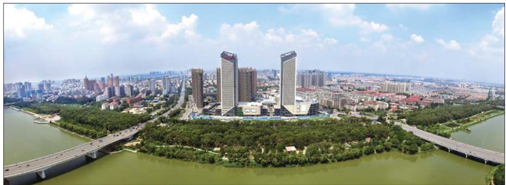
即将投入使用的德州唐人中心写字楼凭借150米的高度成为德州的地标性建筑。