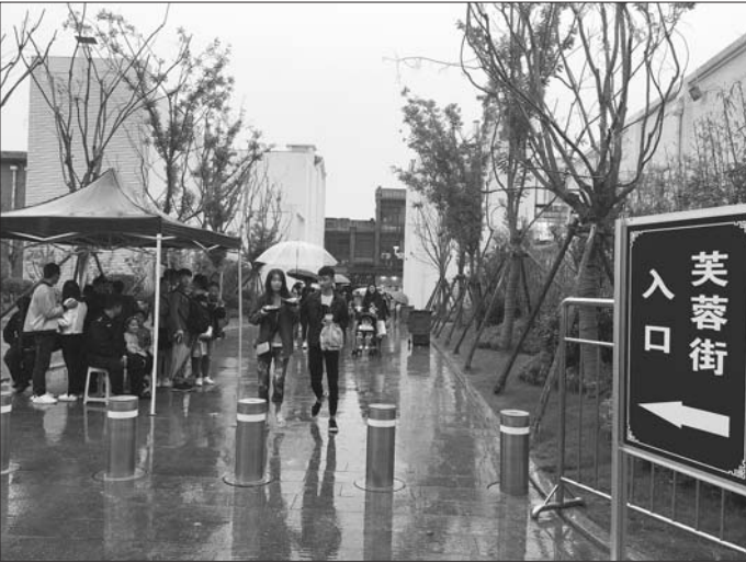
芙蓉街与红尚坊之间的消防通道被打通。

顺河高架玉函路隧道贯通后,将和一期高架桥、老顺河高架桥共同构成快速路网中间贯穿南北的地下快速新通道,将成为牵起二环南快速路、北园高架和北绕城高速的南北贯通快速路,将对舜耕路、英雄山路、六里山路、八里洼路等周边道路及二环东、二环西起到有效分流作用,大大缓解南北向交通压力。