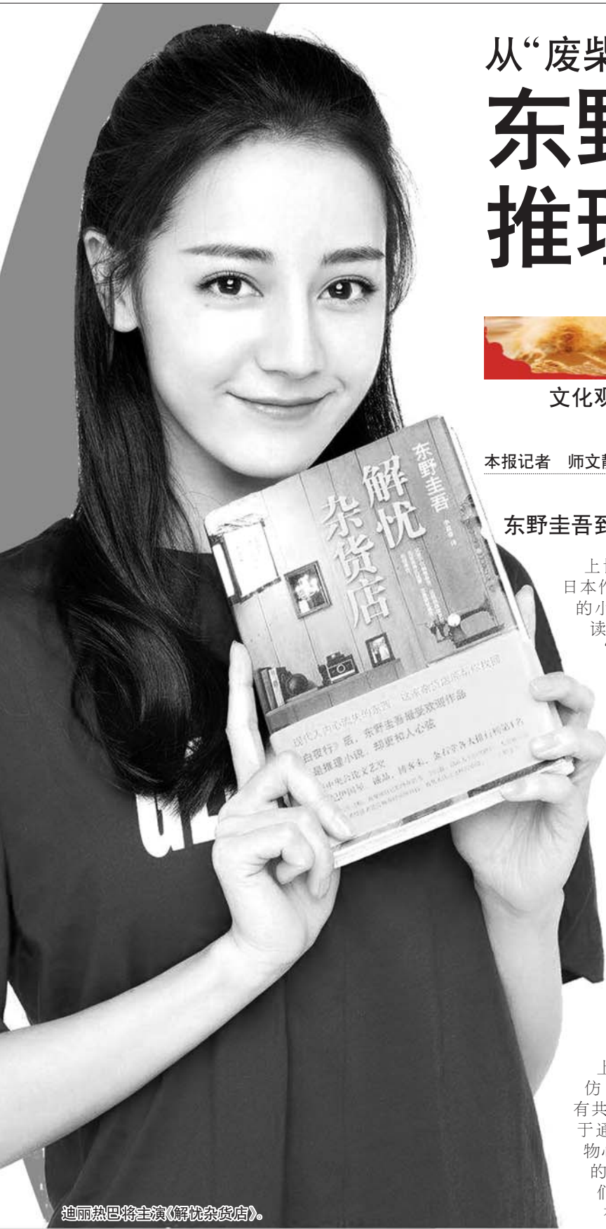
迪丽热巴将主演《解忧杂货店》。