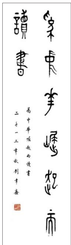
刘聿鑫书法作品:为中华崛起而读书