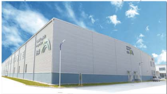
普洛斯(齐河)国际物流园——世界500强“普洛斯”投资建设。

上月，世界500强“美的”相中齐河，决定投资10亿元建设整体橱柜及厨房电器生产项目，预计11月即可开工建设。至此，已有普洛斯物流、中核集团、雅培、恒天然等16家世界500强、中字号企业落户齐河。