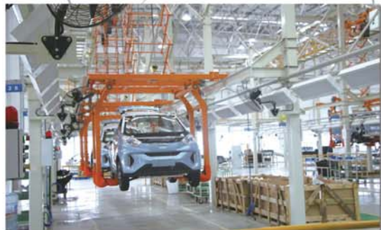
奇瑞新能源汽车齐河生产制造基地——奇瑞公司唯一落户县级城市的新能源汽车项目，也是德州市第一家锂电高速新能源汽车项目。