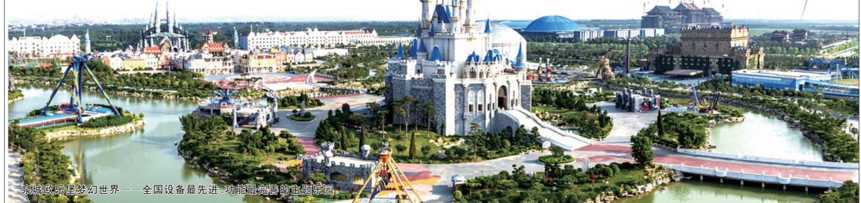
泉城欧乐堡梦幻世界——全国设备最先进、功能最完善的主题乐园。

虽优势独具，但齐河的活力最吸引客商。他们始终将改革创新作为最强动力，做优三大平台，促进产业集聚。按照国家级开发区标准建设经济开发区，综合实力位居省级开发区第13位，加快起步区产业“退二进三”，启动产城融合，入驻企业254家，形成新能源汽车、现代物流等六大产业集群；齐鲁高新技术开发区瞄准国家级高新区标准，按照创建“省城人才创业基地和科技成果转化示范区”的发展定位，重点发展生物医药、智能装备制造、总部经济等产业，建有国家级齐鲁科技孵化器、全省首个中关村海淀园齐河分园和36万平方