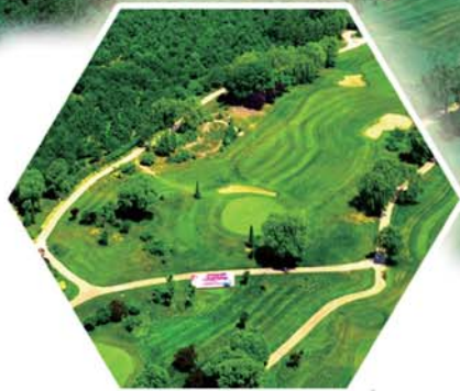
温泉小镇——打造全国一流的“产城融合”示范温泉小镇、济南周边大健康产业基地。

交通密度全国县市领先，建有国家级科技孵化器，隆起三大“省”字号发展平台，落户“世界500强”、“中”字号企业16家，这片投资热土绽放迷人魅力——