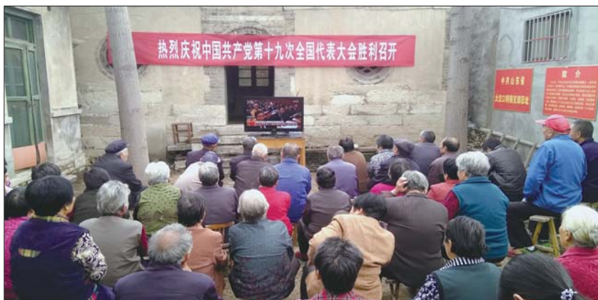
卫驾庄村党员群众一起观看十九大开幕式直播。

现在,村里山上的生产路全部铺上了水泥,再也不愁一年的收成下不了山;建档立卡的18个贫困户已脱贫17户;投资1.2亿元的省级农业良种工程重点项目在村里落地。他们说,相信未来的日子会一天比一天好。