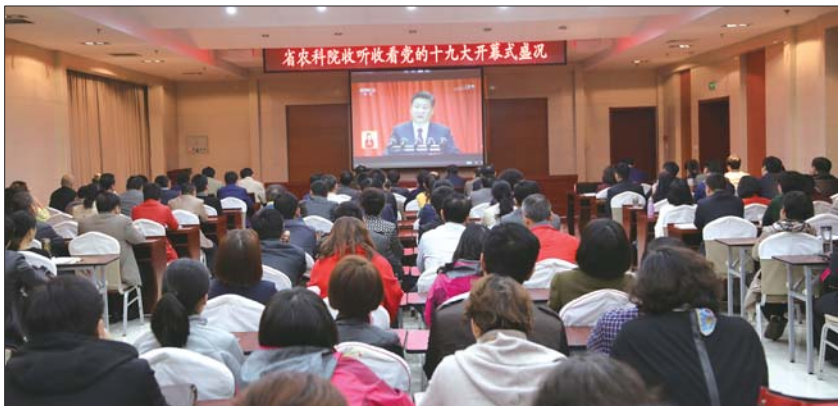
省农科院集中收看十九大开幕式。