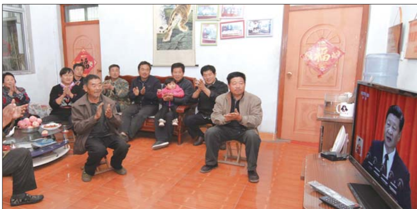
部分“沂蒙六姐妹”子女收看十九大开幕式直播。