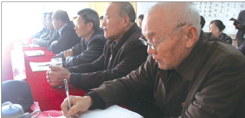
曲阜市周公庙社区的老党员收看十九大开幕式时认真做着笔记。

省农科院科技信息研究所阮怀军研究员表示,聆听报告后,作为农业科技工作者,感到责任重大,未来将围绕农民、农村发展需求,发挥信息技术优势,更多地了解农业科技前沿信息,让老百姓更多感受农业科技的魅力。