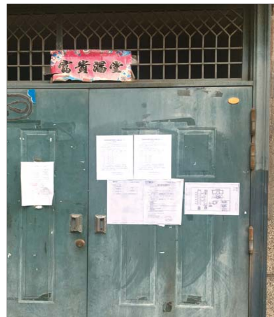
省计量院第三宿舍4号楼张贴出了安装方案