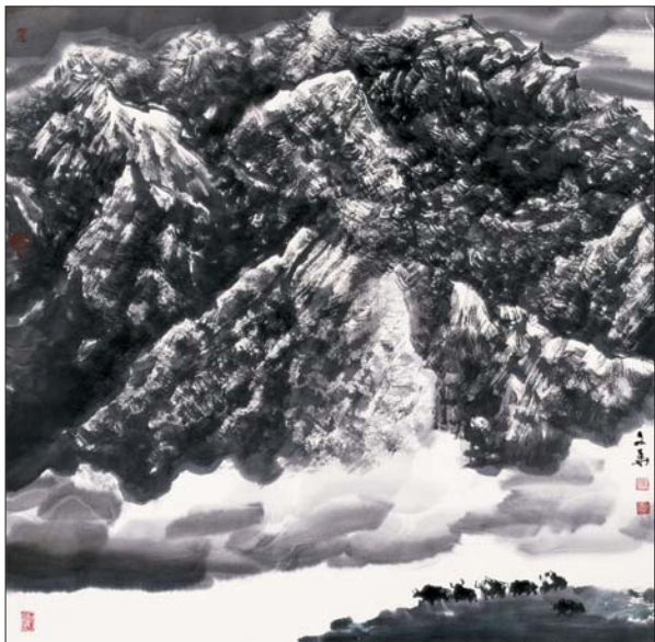
▲高原情 68x68cm 张文华