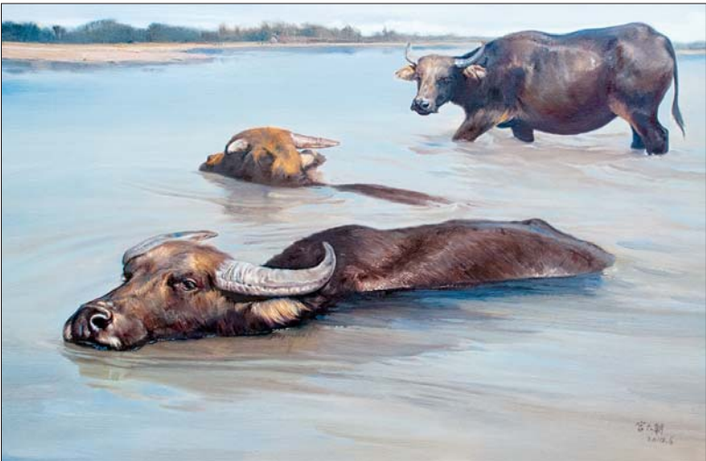
▲夏至 120x80cm 宫六朝

谈到此次展览的策划初衷,策展人范晓先生表示:“在长达40年的艺术实践中,宫六朝先生始终恪守严谨科学