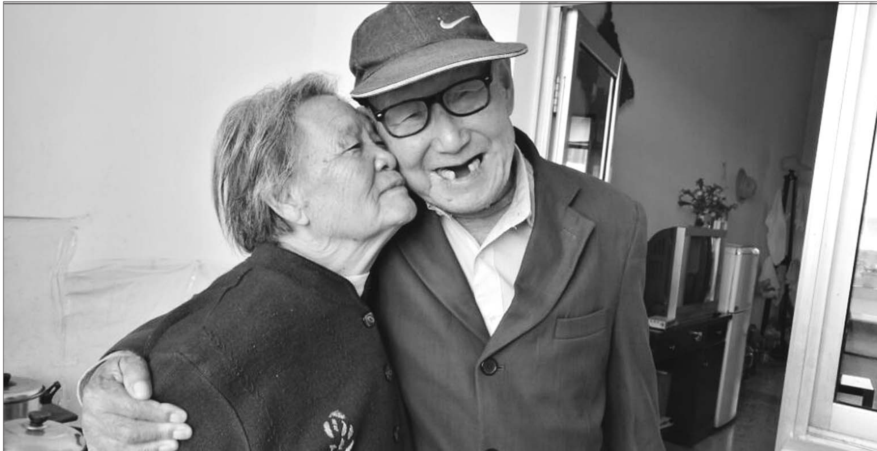
这对“黄昏恋”十分恩爱,现在他们谁也离不开谁。