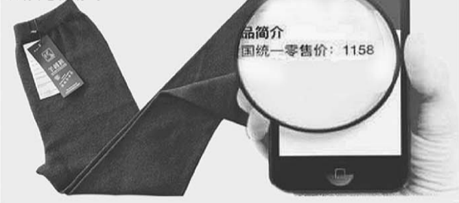
扫描中国物品编码中心发布的条形码可确认优品羊绒裤专柜价格为1158元

源自北纬39度,世界著名的鄂尔多斯山羊绒原产地,珍稀如金,高贵天成,触摸它,就像婴儿肌肤般柔滑;穿上它,犹如沐浴阳光般温暖!贴身随行,自由舒展!你,想拥有吗?