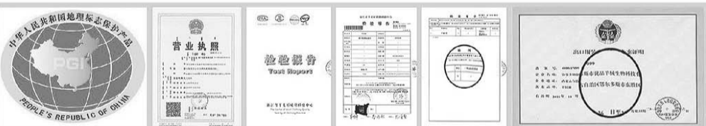
在探访期间笔者查看了优品羊绒裤检验报告、营业执照和出口备案证明等相关手续,真实正规。

储存热能,抵御寒气的侵袭,其保暖性超过了羊毛的3倍,棉花的12倍。一只山羊身上,每年仅能采到10至40克的羊绒,织成一件羊绒裤要经过洗绒、横机、灯检、整烫等30多道工序才能完成,每道工序层层把关,每一批次都严格检查,都有质检报告,都符合出口高品质。董总特别强调:“这次虽然价格低,但是质量不低,售后服务不低,在国家服装包换政策之外,若有任何问题,3天内包退!”