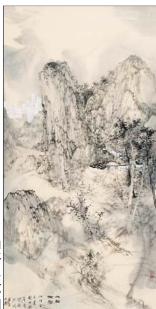
此在彼存之四 138cmx69cm 孙文韬