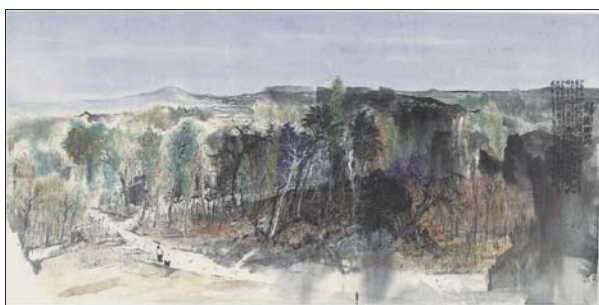
归园田居 240x120cm 张健

在当今书画领域,学术型艺术家因其正统的学习理念和丰厚的艺术素养,逐渐受到书画爱好者的喜爱和欢迎,艺术型博士在某种意义上可谓是学院教育的翘楚,这种优越的教育背景折射出他们高度发展的艺术创作潜力,因此他们的作品也越来越受到藏家们的关注。博士不是艺术探索的终点和全部,更像是一颗优良的艺术种子,为未来艺术的高度发展打下坚实的基础。此次参展的博士学子都在各自专业研究领域孜孜以求,亦各有所成。他们每人都拥有着博士的拼搏精神和历练情怀,并在各自的书画作品中融入了深刻的艺术感悟和创作理念。这是一次来自中国各大美术院校博士生研究成果与问学精神的集体展示,更是一次容纳笔墨传统且关注当下文化语境的学术展览。