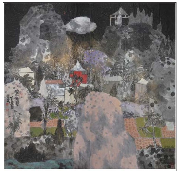
家山祥云 136x136cm 谢其云