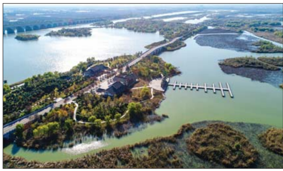
太白湖湿地景色迷人。