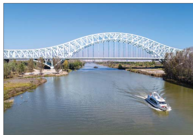
京杭运河大桥横跨太白湖之上。

近年来,各级部门累计投资15亿元对太白湖景区进行升级改造,先后完成景区起步区、人工湿地、生态湿地、植物园、太白文化园、园博园等项目建设,目前正在积极推进游客服务中心和太白湖水上旅游集散中心等项目建设。太白湖景区2013年晋升为国家4A级旅游景区,目前正在申报国家5A级旅游景区和国家级旅游度假区。