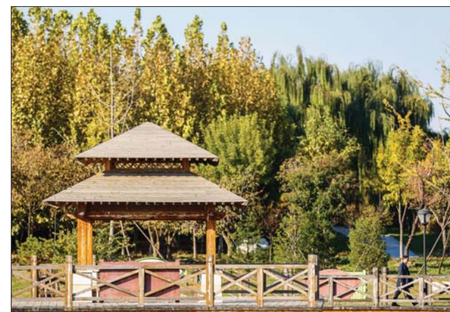
秋季的太白湖景色宜人。