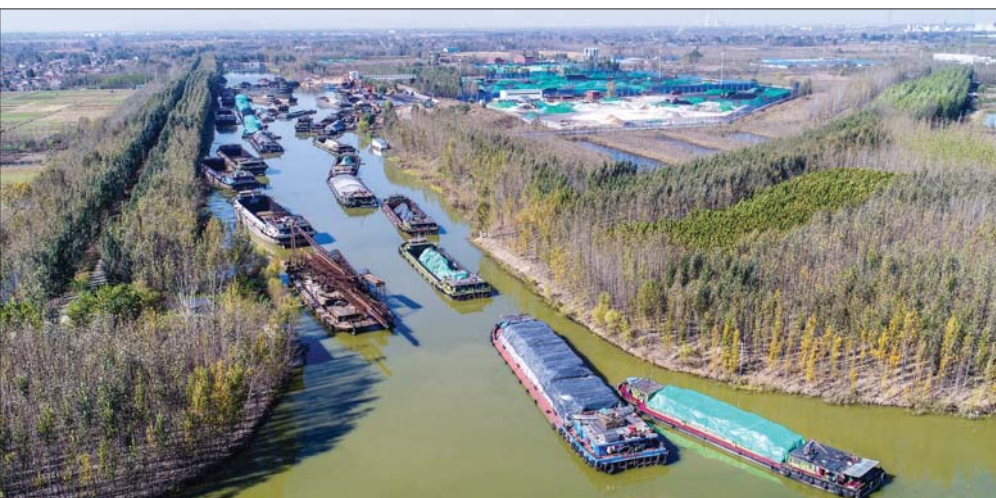
位置的优越性也赋予太白湖更多功能。