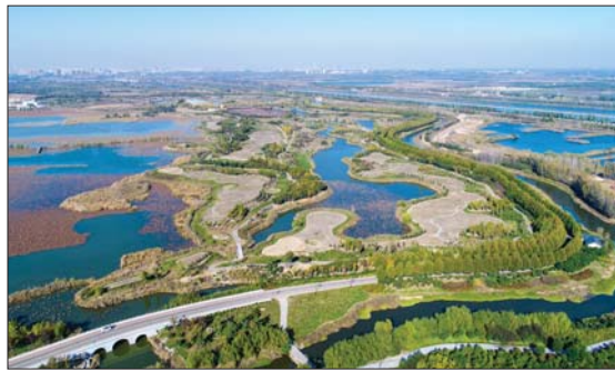
秋季的太白湖,景色让人流连忘返。