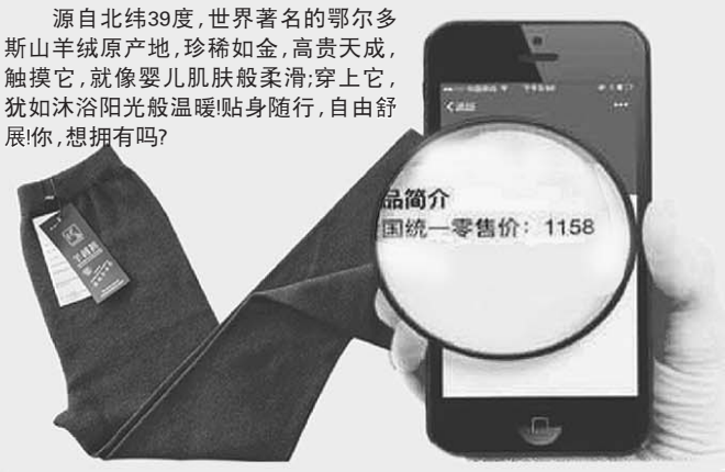
扫描中国物品编码中心发布的条形码可确认优品羊绒裤专柜价格为1158元

这次之所以拿出8万条以198元的价格销售,一方面是刺激消费,清理部分库存,回笼资金,为明年做准备;一方面还是为了以高品质打口碑,迅速占领市场。