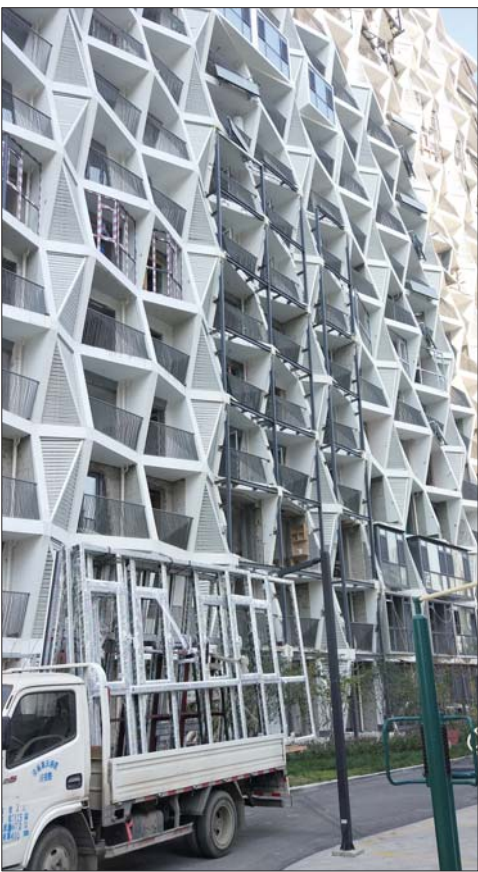
不少业户在阳台外面架起了工字钢架。