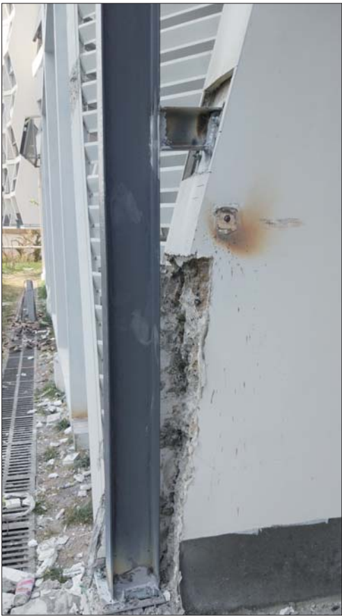
架工字钢架破坏了墙体。