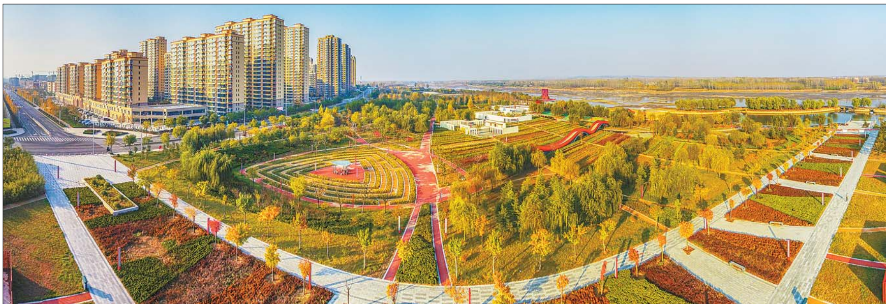
▲美丽的东城新区,暖暖的夕阳也为银杏之城抹金添彩。