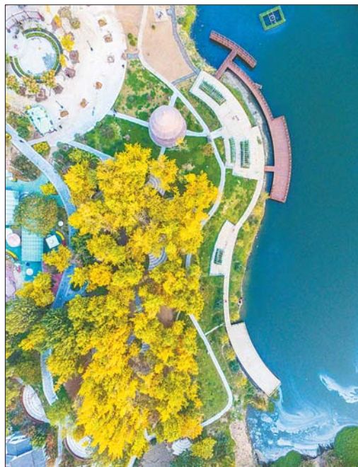
▲城区处处有金色的点缀。