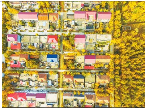
▲家家银杏,户户“金甲”。