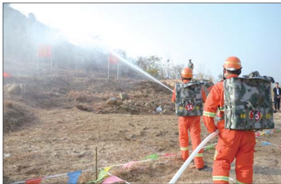
▼ 参赛队员在指定位置打靶。