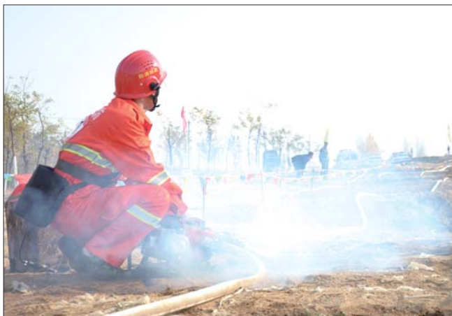
参赛队员保障供水。

本报泰安11月13日讯(见习记者 宁博) 13日上午,泰安市森林消防专业队伍以水灭火装备实战演练活动在新泰市泉沟镇小官庄村团山子林区进行。