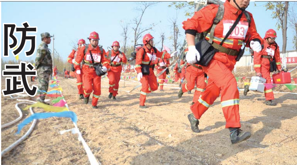
参赛队员争分夺秒抢时间。