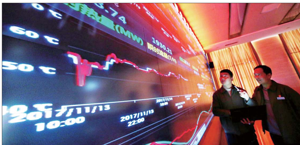
济南热电公司建设了智慧供热服务管理平台,对供暖情况实时监控。(资料片)

构建了基于“人脑”分析的智慧供热系统,将热量输送至千家万户。大到主干管网的供热数据,小到各个供热站的供回水温度,乃至小区居民家中室温,都在智慧供热平台这个控制“中枢”中一一呈现。