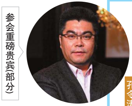
参会重磅贵宾部分

而汇美幼大也将积极投身实体中心的建设。未来三年内,将建设8家直营共享妈妈孵化基地,16家汇美国际托婴中心,促成150家加盟托婴中心。汇美幼大共享妈妈孵化基地将服务于1万家机构式托婴中心,20万家(0-3岁婴幼儿)居家式托婴中心。 同时汇美幼大还制定了“乘云驾数”发展计划(云服务、大数据),自主研发APP线上课程,将妈妈常规必备的一些技能放到线上进行。