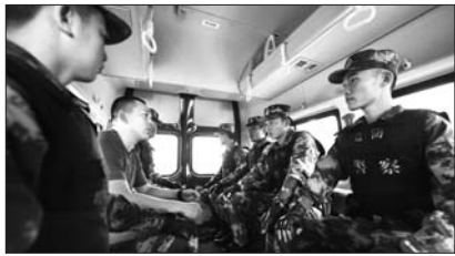
边防民警赴乳山执行抓捕任务。