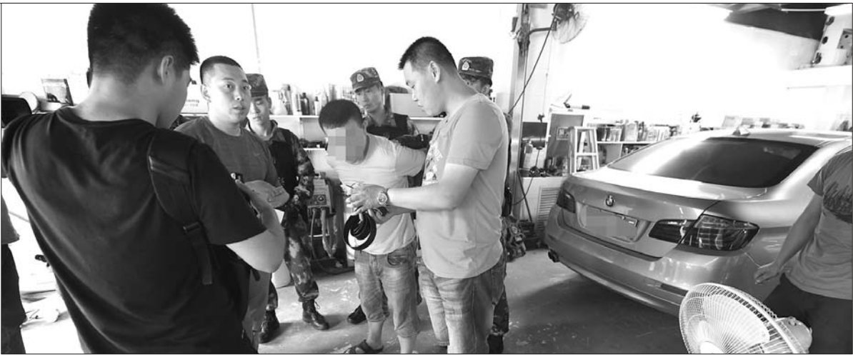
在威海乳山一家洗车店里,一名团伙骨干成员被抓获。

今年,烟台市公安边防支队破获一起骗取多次往返旅游签证前往韩国打工的特大偷渡案件,彻底摧毁了一个盘踞在烟台、威海、乳山等地活动的特大组织偷渡团伙。该类型案件因隐蔽性较强,取证困难,一直无法有效打击,致使山东多地此类型偷渡活动猖獗。目前,该案已侦查终结,准备移诉至检察机关。