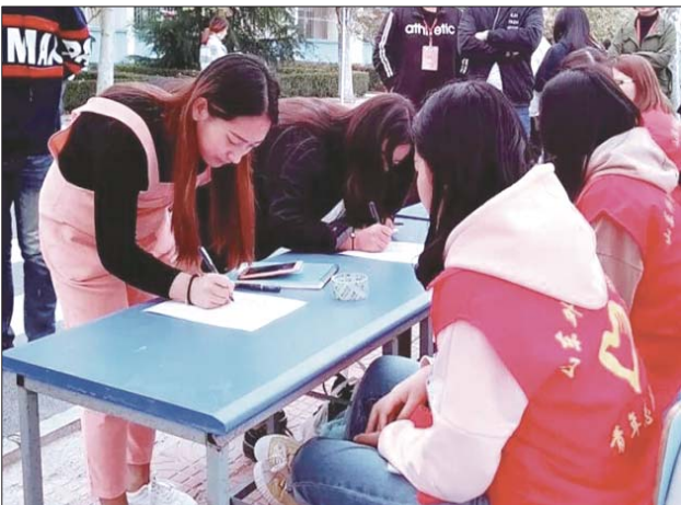
“衣旧在,爱常在”爱心捐物活动现场。

乳山市滨海新区旨在通过此次捐赠活动,既弘扬了一直以来所秉持的无私奉献精神,又向广大学生宣传了志愿服务理念,帮助学生们树立起服务、奉献的人生观,扎实做好志愿服务工作,将爱心接力棒传遍银滩。