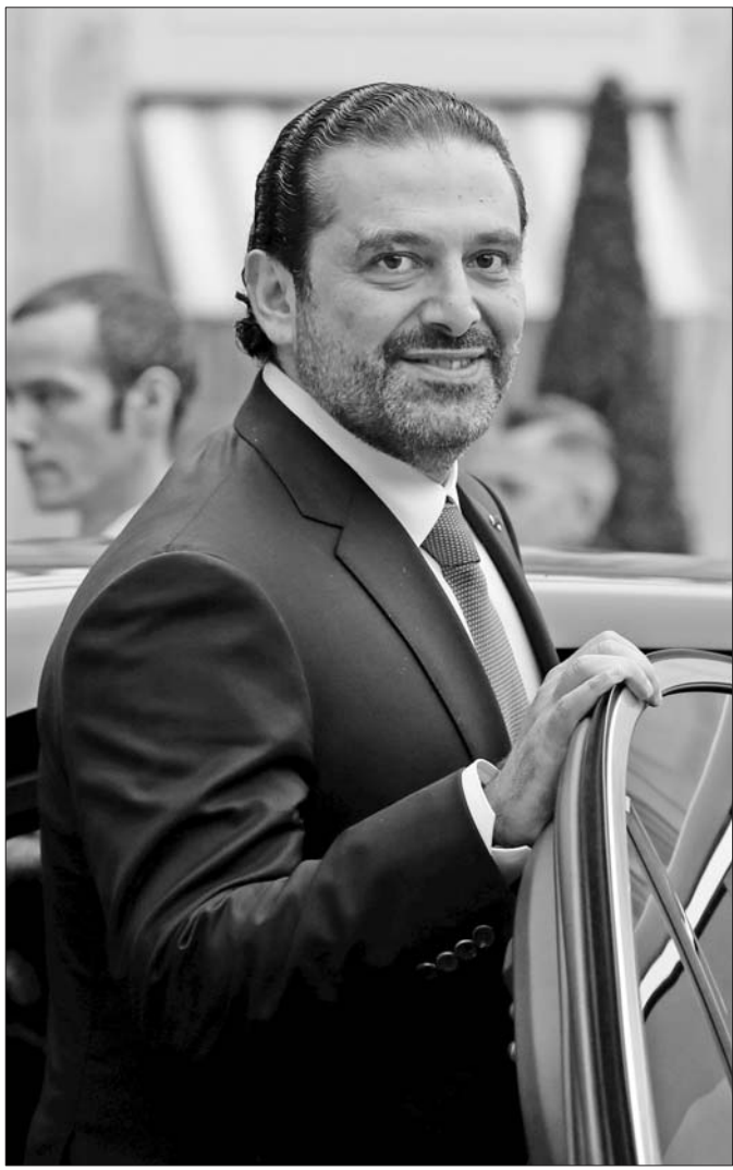
18日,日前宣布辞职的黎巴嫩总理哈里里抵达法国爱丽舍宫。