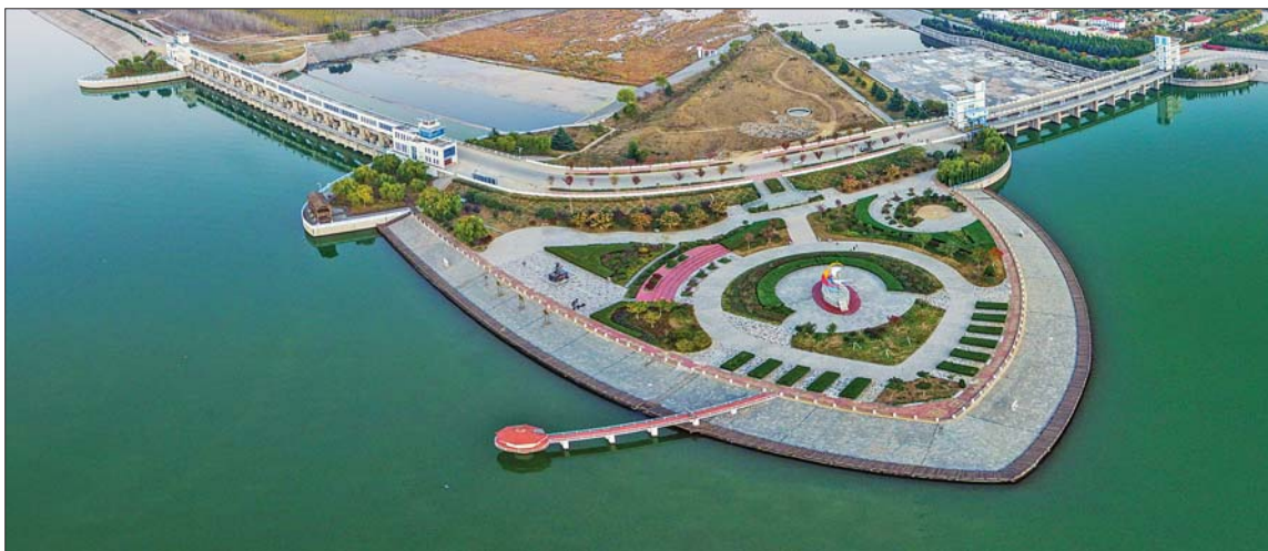
壮观的石梁河水利枢纽。