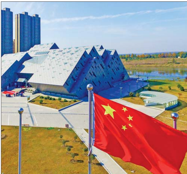
水晶造型的水晶博物馆。