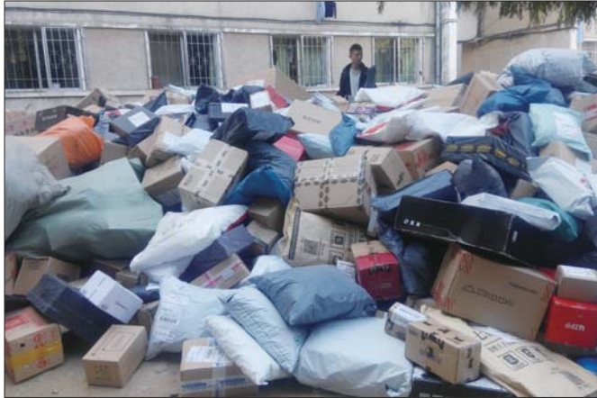
烟大一个快递接收点一天可收快递3000多件。

“从14日开始,快递高峰逐渐到来,预计能持续一周。”据派送点负责人谭超介绍,这个派送点目前日收件量在3000多件,除此之外,校园内还有多处派送点,整个烟大校园日收件量超过10000件,市内其他几个高校情况也差不多。市区五所本科高校日收货量预计在5万