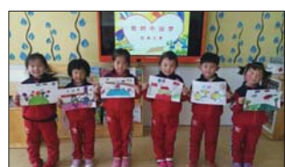
弘扬核心价值观 日前,沂源县振兴路幼儿园积极开展行动,开展了唱响社会主义核心价值观的系列活动,传播社会正能量。(李欣)

为促进教师更好地利用现代化信息技术辅助教学,日前,皇城一中开展了新学年信息技术培训。这次培训重点是针对微课制作技巧,诸如视频编辑、音效合成、动画设置等操作要领作详细讲析。(李波)