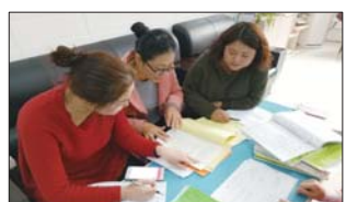
精细化管理,常态化促进 为全面提升保教质量,近日,沂源县南麻街道中心幼儿园组织开展了教学常规及卫生保健常规工作检查活动。(亓永玲)