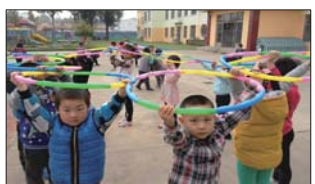
户外活动丰富多彩 为丰富幼儿户外活动,日前,沂源县鲁村镇中心幼儿园根据幼儿爱好开展了丰富多彩的系列户外活动。(张慎明)