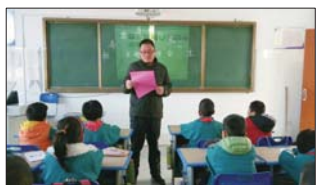
召开禁毒教育班会 为让学生了解毒品的危害,近日,沂源县鲁村镇中心小学以“拒毒禁毒,阳光一生”为主题,组织了学生班会活动。(李德成)

为确保幼儿的健康成长,张家坡中心幼儿园多渠道开展幼儿健康教育。加强幼儿体能活动;加强幼儿的安全卫生教育;培养幼儿良好的生活习惯;加强消毒工作,杜绝流行病的发生。(任晓寒 李清娥)