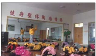
自主选课日助力学生发展 为助力学生全面发展,自开学初,桓台县马桥实验小学开展多种社团活动。涵盖了艺术、科技、体育、益智等多个领域。(王铨)