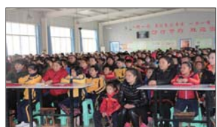
家庭教育进校园 日前,桓台县家庭教育讲师团走进起凤小学,就家庭教育中“如何和孩子沟通”,“如何教育孩子”等问题,结合实例做了讲解。(王会)