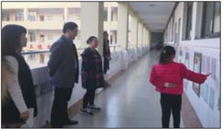
墙壁文化展班级风采 日前,张店区傅家镇中心小学开展班级墙壁文化评比活动。旨在为学生个性发展和健康成长提供良好的班级文化氛围。(徐家鹏)

近日,沂源县历山街道成教全体教师走向社区,为居民宣讲秋冬季骑车安全正确防护方法以及注意事项,形象生动的宣传材料和讲解受到居民一致好评。(刘华 刘淑丽)