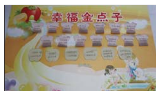
班级文化唱响主旋律 沂源县荆山路小学高度重视班级文化建设,每个班级都建设了具有鲜明特色的班级文化,唱响了班级文化主旋律。(刘成学)