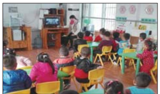
关心孩子成长 国际儿童日来临之际,高青县田镇中心幼儿园开展了以“爱心与你陪伴,成长路上不孤单”为主题的教育活动。(孙国平 魏秀芹)

近日,凤凰镇召口小学开展“学校管理提升月”活动。通过落实“一岗双责”安全责任制;抓好安全教育工作;严格校车安全管理;加强学校周边安全综合治理等一系列活动,构建平安和谐校园。(杨朝生)