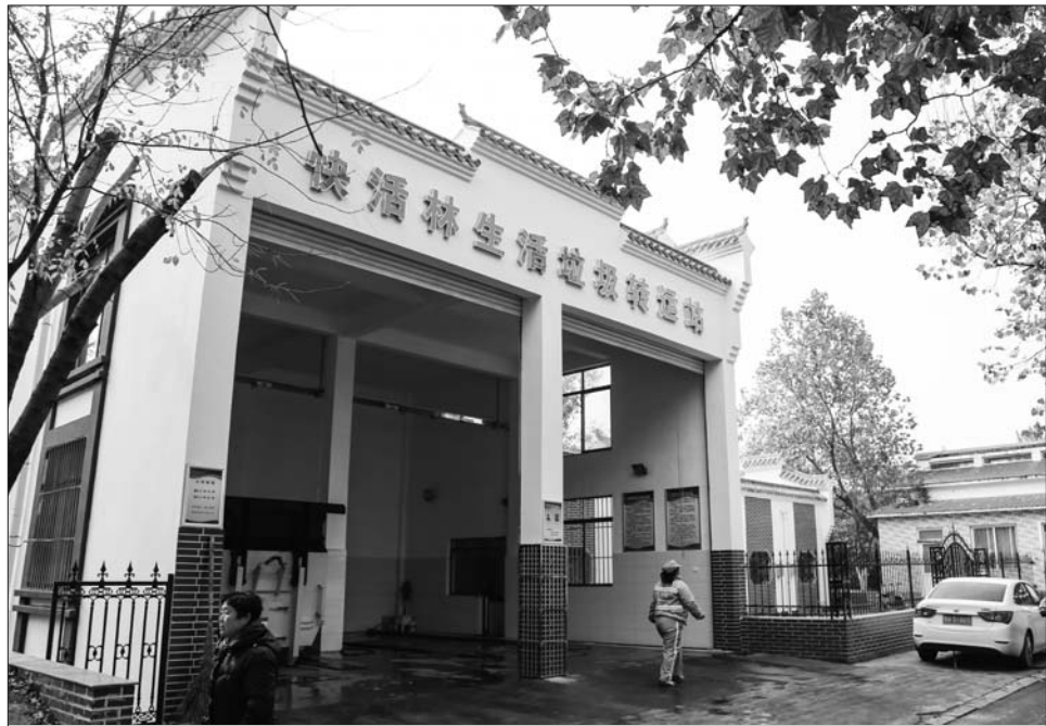
改造后的垃圾转运站整洁干净。

今年,城区中小型垃圾转运站改造提升工程被列入济宁市政府“为民办十件实事”中。改造后,如今的垃圾中转站不仅没有污水也没了异味,而且日转运能力也从原来的30吨增加至80吨。目前,7座中转站的改造改建任务已全部完成。