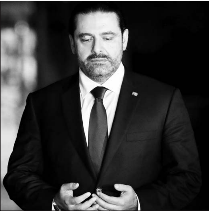
21日,在黎巴嫩贝鲁特,哈里里在自己曾任黎巴嫩总理的父亲拉菲克·哈里里的墓前拜谒。 新华/路透

黎巴嫩总理哈里里终于兑现回国承诺,于21日深夜飞抵黎巴嫩首都贝鲁特。美联社报道,哈里里抵达贝鲁特国际机场时表情严肃。他直接从机场乘车前往父亲、黎巴嫩前总理拉菲克·哈里里的墓前拜谒,随后才返回总理官邸。