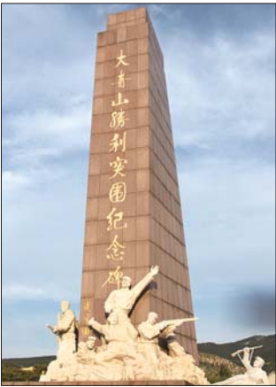
大青山战役纪念馆