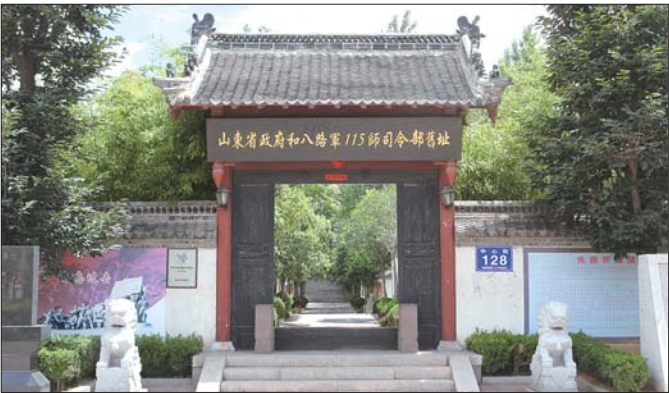
八路军115师司令部旧址

在解东看来,旅游景区丰富了教育基地的教学形式。利用景区的各种设施和场景,精心设计了唱红歌、