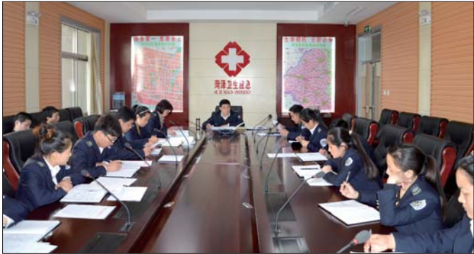
锐意进取的菏泽市120急救指挥中心队伍。

市120急救指挥中心在市卫生计生委的正确领导下,严格按照“就近就急,救治能力,患者自愿”的原则对急救车辆进行统一指挥调度,发挥了良