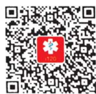
苹果版下载二维码

市民可通过各大APP市场搜索“互联急救”下载。下载此软件并注册输入自己或家人的信息。注册此软件后,一键拨打120急救电话时,调度中心接通后会接收到呼救人的精确位置和注册时填写的信息。避免了报警人表述不清导致不能准确派车的情况。