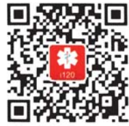
安卓版下载二维码