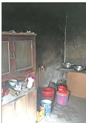
张立帅家家徒四壁。

11月25日,德州市平原县坊子乡东崖庄村。冬日里这座鲁西北平原的普通小村庄格外的静谧,村民崔玉顺看着对门王秀菊家紧闭的大门,不由得叹了口气。“大人孩子谁看了都心疼,这门关一次我心疼一次。”崔玉顺说。