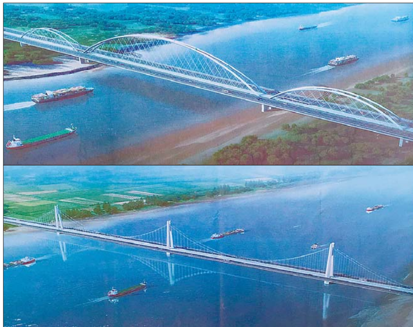
上图:齐鲁大道跨黄河大桥(效果图) 下图:凤凰路跨黄河大桥(效果图)