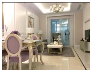
103平米三居客厅实拍