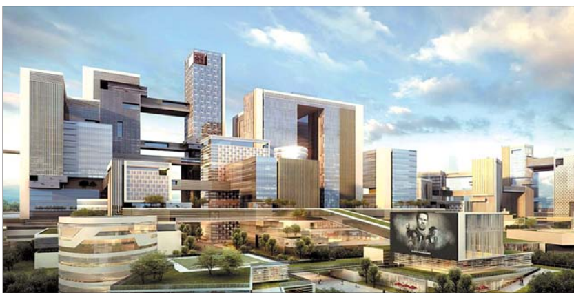
国际医学中心效果图。(资料片)

济南国际医学科学中心自提出之日,就吸引了广泛关注。建设这样一个医学科学中心,旨在将济南市打造成全国医学领域首屈一指的产学研高地,同时也可以助推济南西部的发展。如何才能实现这一目标?14日,济南市政协召开“加快推进济南国际医学科学中心建设”专题协商会,政协委员、专家学者们围绕这一问题纷纷给出自己的建议。