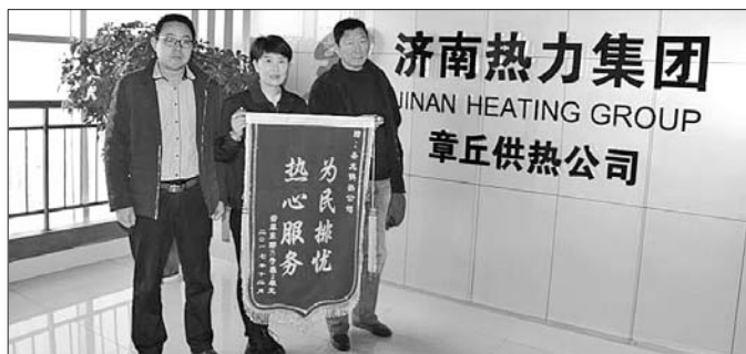
翡翠东郡业主代表为济南热力集团送锦旗。