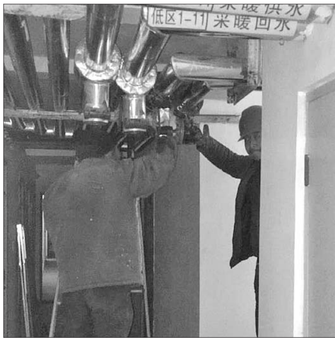
奋战在一线的“供暖”卫士。

“六年了,我们小区的居民今年终于可以在家和老人、孩子开开心心地过个‘温暖’的春节了,这都感谢圣龙供热公司不忘初心,倾心服务,他们这种一心为群众着想的无私奉献精神着实让人感动。”12月12日上午,翡翠东郡小区居民们派代表到章丘供热公司办公室表达对圣龙供热公司优质、热情供暖服务的感激之情,并送来一面红彤彤的“为民排忧解难,热心服务”锦旗。