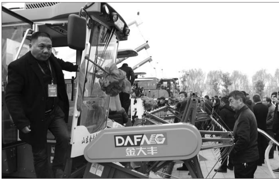
一名销售商开心地进入驾驶室参观。

位于兖州区的金大丰公司今年产销各类收获机3680台,实现销售收入4.3亿元。近年来,金大丰投资8000多万元先后上了五台激光切割机,两条装备线,保证了产品质量的可靠性和随市场快速反应的能力。今后,会有更大的投入用在机器上。在材料方面,企业坚持对供应商按照三化要求动态管理,组织有技术质量供应人员参加的考核评审小组,到各厂家进行现场考核评审,通过考评确定供货资格,从供货源头上把住质量关。同时,在工艺、环境、资本运作等环节,金大丰将在今后下更多的功夫,力争实现企业早日实现上市目标。