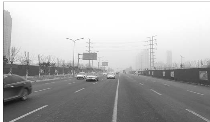
花园东路“肠梗阻”打通后,拥堵大大缓解。

打通断头路、卡脖路,对优化片区交通,增设公交车道以及带动片区发展都有很大作用。“打通一条断头路工作量远大于新建一条路,但是其作用也远大于新路。”据悉,奥体西路等断头路、卡脖路已经列入改造计划,这些道路将纳入济南高快一体路网中,发挥更大作用。