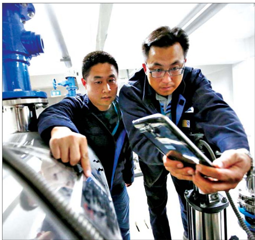
济南水务集团工作人员正在查询厂站实时运行数据。

济南的偷水者大多为居民和大中型用水单位,包括一些私营企业、餐馆等。市区一些重点路段、施工工地和城乡接合部,是“偷水”的重灾区。为打击偷水行为,水务集团于2005年6月成立稽查大队。十年来,通过开展警企联合专线治理、大户水表检查、特行及经营用水专查、建筑工地及村居排查等稽查管理,努力维护泉城供水秩序。据济南水务集团相关负责人介绍,济南水务还将进一步规范用水秩序,维护市民用水合法权益,加大对盗窃用水行为的打击力度。