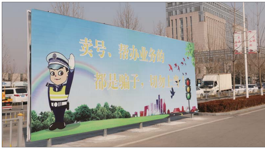
济南市车管所内的提醒标识非常醒目。

很多刚买车的人,都想给爱车挑选一个“吉利”的号牌。一些人正是抓住车主的这种心理,自称能选连号、吉祥号等各种靓号,忽悠车主并牟取不当利益。济南市车管所民警表示,“黄牛”根本没有什么“独门秘笈”,只是他们对现有的选号流程较为熟悉而已,提醒车主谨防上当受骗。