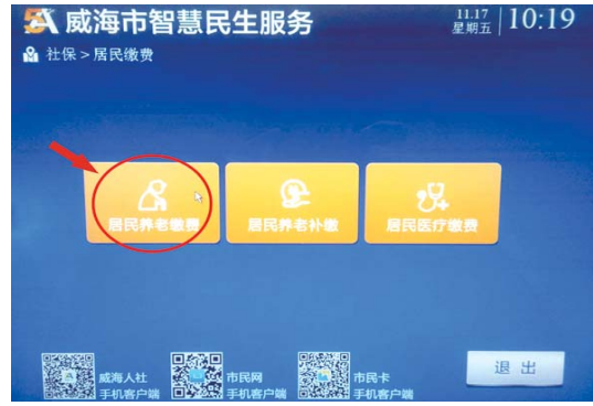
点击“居民养老缴费”