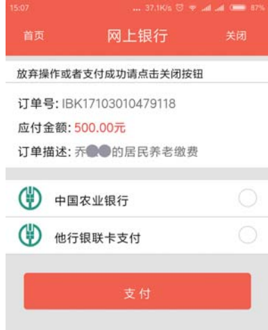
选择合适的方式支付