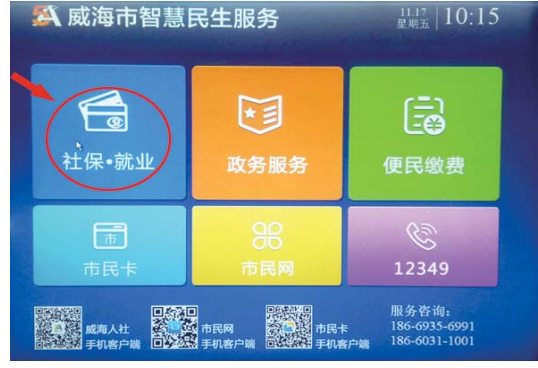
在主页面点击“社保·就业”