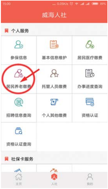
点击“居民养老缴费”