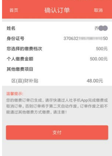
确认信息无误点“支付”