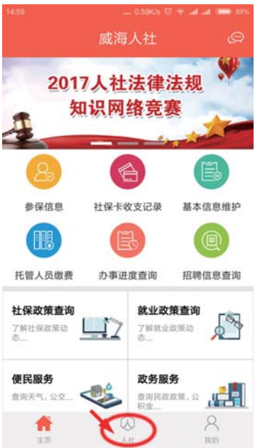
打开“威海人社”手机APP，点最下面“人社”