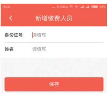
新增缴费人员，并填写信息