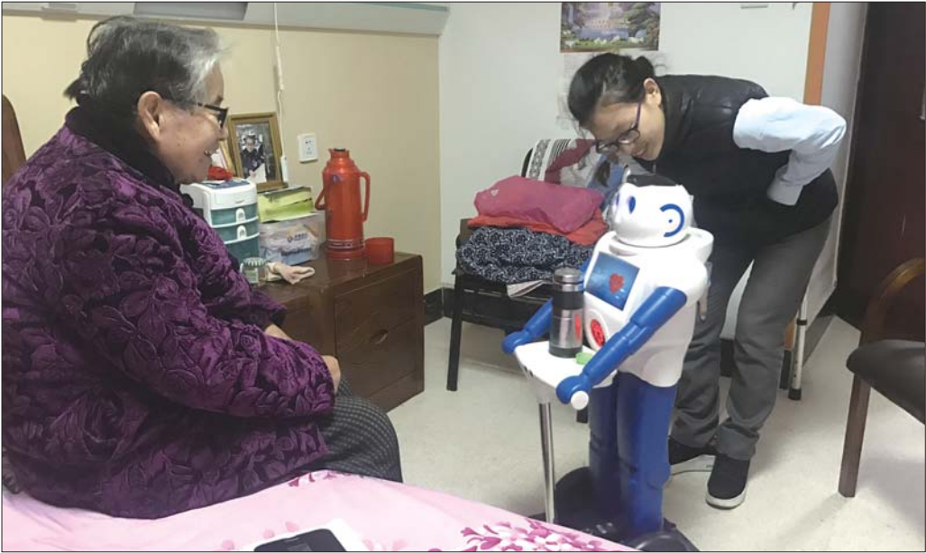
济南槐荫区尊尚老年公寓,在工作人员的指挥下,“旺仔”给刘奶奶送来了水杯和药。

危害,从市面上采集了38个品牌共40批次样品进行监测。结果显示,80%的批次存在安全隐患。有的样品后端信息系统存在越权漏洞,同一平台内可以查看任意用户摄像头的视频;有的样品允许任意查看或下载存储在后端信息系统的用户注册信息和监控视频。