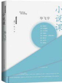
《小说课》 毕飞宇 著 人民文学出版社

如果说电影《芳华》是属于导演冯小刚的回忆录,那么原著小说则是作家严歌苓极具现实主义批判的忏悔录。好人做尽的刘峰和受人欺辱的何小蔓(电影中的何小萍)各有其原型,严歌苓想要借此表达对他们的忏悔:“我从‘我们’当中走出来,来表达我们当时的集体的忏悔。”除去小说中的年代元素,《芳华》讲的还是人性:“人性当中永远不可能消失不安感,你要结成集体迫害这个人的时候,其实是你转移了这个不安感。人对另外一个人施暴的时候,整个人群都在退化。”