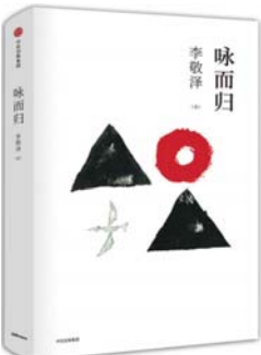
《咏而归》 李敬泽 著 中信出版集团

《鱼王》由十三个内容相对独立的“叙事短篇小说”组成,全部围绕着人与自然的关系,深入细致地描绘了充满神秘诱惑的西伯利亚、生活在那里的人们以及他们关于生活的沉思。上世纪70年代以后,苏联文学从关注英雄主义和战争题材转向对更深层人性的挖掘,尤其体现在对人的道德观的思辨,阿斯塔菲耶夫是其中最典型的一位。他将具有自传性质的故事根植在广袤的西伯利亚平原,在自然和人的相处中,他目睹了人在掠夺自然时是如何丧失了人性。