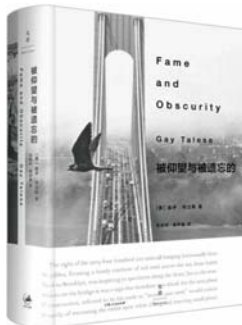
《被仰望与被遗忘的》 [美]盖伊·特立斯 著 上海人民出版社

在诵读传统经典时,作家李敬泽找到了精神上“咏而归”的快乐。在他的眼里,接触经典、古文、传统,是一个轻松愉悦、如沐春风的过程。随笔集《咏而归》开篇谈及孔孟,而后是《诗经》,流转过整个华夏历史,最后收笔于李敬泽自己的生活。李敬泽在书中追求回到古典的“文”的写作,从过去的故事中认识中国文化伟大传统的丰富性,在互联网新媒体时代,这种传统正重新获得生命力。