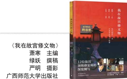
《我在故宫修文物》 萧寒 主编 绿妖 撰稿 严明 摄影 广西师范大学出版社

《仿生人会梦见电子羊吗?》故事发生在未来时空中生态系统崩溃后的地球,男主角里克·德卡德是一名专门负责追捕逃回地球仿生人的赏金猎人。“仿生人会梦见电子羊吗?”看上去像是在追问仿生人有没有灵魂,但这一追问反复出自里克·德卡德之口,他进而感觉自己迥异于常人而陷入情感困惑的绝境。这本书的英文原著初版于1968年,书中没有技术细节,也少见科学的理性精神,却充满了超越科幻的哲学意义,作者更加关注社会变迁带给人类精神层面的巨变、自我觉醒以及与科技相关的伦理问题,让我们重新审视“我们究竟何以为人”。