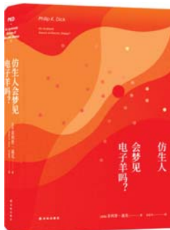
《仿生人会梦见电子羊吗?》 [美]菲利普·迪克 著 译林出版社

美国著名记者、“新闻主义”代表人物盖伊·特立斯,自20世纪60年代以来,他写的特稿惊艳了整个新闻行业,至今仍然是全世界模仿的对象。《被仰望与被遗忘的》收录了他的经典纪实作品。他那些描写纽约城市生活变奏曲的非虚构写作,加入了小说的技法,开创了20世纪新闻界独一无二的文体。比起体育赛里的获胜者,他更爱采访失败的一方;比起事实报道,他更爱人物细节和内心独白;他还写下了关于纽约的一系列小人物文章,从开电梯的人到地铁售票员,从流浪的野猫到行色匆匆的上班族。特立斯之前,没有人如此打量城市。