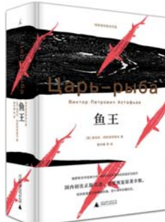
《鱼王》 [俄]维克托·阿斯塔菲耶夫 著 广西师范大学出版社