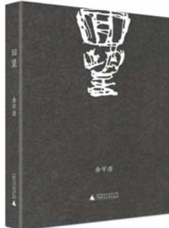
《回望》 金宇澄 著 广西师范大学出版社

小说到底该如何恰当解读?作为作家的毕飞宇用一种与传统迥然相异的阅读方式解读古今中外名著经典,从“创作者”的角度向读者们展示了作为“一千万分之一”怎样读出与众不同的“哈姆雷特”。相比于时代背景、段落大意、中心思想式的小说解读,毕飞宇将自己阅读过程中体会到的那些欣喜、感动、惊讶甚至战栗与读者分享。他认为,阅读小说和研究小说从来就不是为了印证作者,相反,好作品的价值在于激励想象、激励认知。