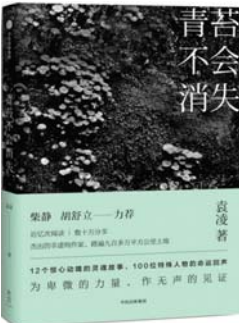
《青苔不会消失》 袁凌 著 中信出版集团

金宇澄采用三种不同的叙事方式讲述了作者父辈的故事。父亲的江南旧族在上个世纪初的新旧社会转型中败落,母亲的城市新兴家族在20世纪30年代城市工商业发展中繁荣,但这一切终究抵不过那革命的浪潮,两人被历史大浪簇拥着,加入革命阵营,接受错综复杂的境遇和历史宿命。作者无意仰视父辈的人生传奇或拔高他们的个体价值,目的仅仅如其在书中最后所言,面对父辈记忆“迅速脱落与枯萎,随风消失,在这一点上说,如果我们回望,留取样本,是有意义的”。