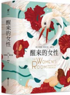
《醒来的女性》 [美]玛丽莲·弗伦奇 著 北京联合出版公司

1941年的一个夏日,波兰小镇耶德瓦布内中的一半人谋杀了另一半人:镇上的犹太人被打、溺毙、烧死,共计1600人,仅7人幸存。这一系列恶行并非出自抽象的“纳粹”,而是拥有真实面孔和姓名的人们,这些犹太人所熟识的人——他们的邻人。证词、证据、杀人凶手、杀人动机,犹如一本侦探小说,那一天发生的事被一步步复原和重构。格罗斯在本书中以二战期间的波兰——犹太关系为讨论核心,揭开了人类现代史上公认的受害者波兰人在极端环境下残暴的一面,也引导我们思考普遍潜伏的危险:人类的兽性在何种情况下会被激发?为何会有民族之间的仇恨?该如何面对自己民族失败和黑暗的历史?