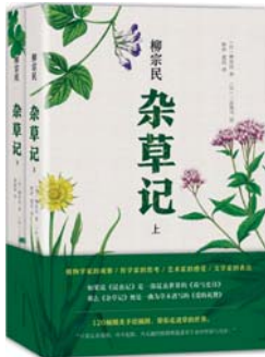
《杂草记》 [日]柳宗民 著 四川文艺出版社

作者征引古今中外的诗作与诗论,就博弈、滋味、声文、肌理、玄思、情色、乡愁、死亡等话题,展开了精彩的专题性论述,每篇都“有诗为证”,从楚辞、陶渊明到袁克文,从鲁迅、戴望舒到卞之琳,从郑愁予、张枣到朱朱,从莎士比亚、里尔克到特朗斯特罗姆,纵及古典、现代与当代,横及本土、东方与西洋。为什么要读诗?江弱水回答:“我们读诗,就是用别人的语言来照亮我们的世界。伟大的诗人都是伟大的精神现象,他们哀乐过人,像一把尺子替我们丈量另外两个世界的广度、深度和高度。”