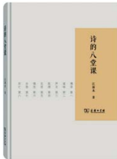
《诗的八堂课》 江弱水 著 商务印书馆

如果我们还能从一百五十多年前莫奈的《日出》、梵高的《星空》中,依稀辨认出艺术“原来”的模样,那么,一百五十年后安迪·沃霍尔的金汤宝罐头、达米恩·赫斯特的腌制鲨鱼,还有翠西·艾敏乱糟糟的床,足以让我们看到艺术的其他可能。艺术评论家威尔·贡培兹在《现代艺术 150 年》中避开艰涩的理论,用诙谐幽默的语言梳理了二十多个现代艺术流派的渊源流变,勾勒出现代艺术的发展历程,见证了艺术家对“何为艺术”的无尽追问,这也是他们对周围世界的回应与抵抗。