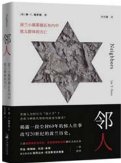
《邻人》 [美]格罗斯 著 中央编译出版社

《艾希曼在耶路撒冷》是汉娜·阿伦特最具争议性的一本书。作为奥斯维辛集中营的主要负责人,艾希曼对死于该集中营的20万犹太人负有不可推卸的责任。1961年,耶路撒冷地方法院对艾希曼开展了一场旷日持久的审判,汉娜·阿伦特就这场审判为《纽约客》写了五篇报告,后集结成《艾希曼在耶路撒冷》一书,提出了“平庸的恶”的概念。恶的化身未必是狂暴的恶魔,也有可能是平凡、敬业、忠诚的小公务员。艾希曼由于没有思想、盲目服从而犯下的罪,并不能以“听命行事”或“国家行为”的借口得到赦免。阿伦特认为,在极权主义和恐怖主义之下,最重要的是不失去思考和判断的能力,这也是她的著作持续传达给读者的价值。