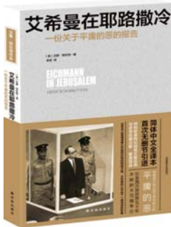
《艾希曼在耶路撒冷》 [美]汉娜·阿伦特 著 译林出版社

《艾希曼在耶路撒冷》是汉娜·阿伦特最具争议性的一本书。作为奥斯维辛集中营的主要负责人,艾希曼对死于该集中营的20万犹太人负有不可推卸的责任。1961年,耶路撒冷地方法院对艾希曼开展了一场旷日持久的审判,汉娜·阿伦特就这场审判为《纽约客》写了五篇报告,后集结成《艾希曼在耶路撒冷》一书,提出了“平庸的恶”的概念。恶的化身未必是狂暴的恶魔,也有可能是平凡、敬业、忠诚的小公务员。艾希曼由于没有思想、盲目服从而犯下的罪,并不能以“听命行事”或“国家行为”的借口得到赦免。阿伦特认为,在极权主义和恐怖主义之下,最重要的是不失去思考和判断的能力,这也是她的著作持续传达给读者的价值。