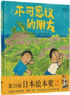
《不可思议的朋友》 [日]田岛征彦 著 北京联合出版公司

谷口治郎与宫崎骏是同辈的日本漫画家,其作品享誉欧美。《散步去》讲述中年男士和家人搬到小镇上,开始了散步的日子——行走过如同睡去的街区,攀爬过微缩的富士山景,观察富有生趣的动物,欣赏不期而至的风景。作品中所传达出来的正视生活、热爱日常的生活态度,给当下繁忙的快节奏生活带去一份静谧、一丝清凉和意想不到的惊喜。上世纪90年代《散步去》在法国出版时,书中堪比小津安二郎镜头下的美丽日常,让欧洲读者沉醉不已。而到了今天,我们的生活仍然让很多人无法享受到闲暇,很难体会到散步的乐趣——也许现在的读者只能从画面中感受到生活的美和静谧。