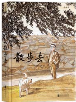
《散步去》 [日]谷口治郎 编绘 北京联合出版公司

2011年至2014年,埃莱娜·费兰特以每年一本的频率出版《我的天才女友》《新名字的故事》《离开的,留下的》和《失踪的孩子》这四部情节相关的小说,被称为“那不勒斯四部曲”,截至今年年底中文简体版只出了前三本。它们以史诗般的体例,围绕意大利那不勒斯两个女孩莉拉和埃莱娜的命运展开,关注她们从女孩到妇人的整个生命过程。费兰特深入挖掘了两个女孩之间夹杂着钦慕与嫉妒的友谊,讲述她们受彼此的影响,在人生的不同阶段做出的决定与选择,以及一路上的牺牲与成长。《离开的,留下的》讲述中年的埃莱娜和莉拉分别进入婚姻,她们的人生道路渐行渐远。