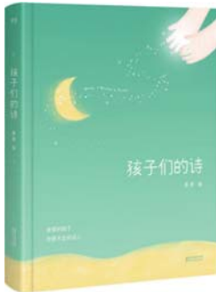
《孩子们的诗》 果麦 编 浙江文艺出版社

《醒来的女性》堪称“小说版的《第二性》”,将上世纪二三十年代十几位美国女性最真实的生活面貌展现出来,让人们看到在那个女性的权利尚未得到重视的年代中,女性在平凡生活的摇摇晃晃里究竟经受了什么样的侵害与蔑视。小说的时代背景聚焦在上世纪三十年代美国社会,虽然已经过去了近百年的时间,但是放眼我们如今的社会,对女性的种种偏见仍然大同小异:女性走出校园后,长辈给的常见建议是“考公务员”“当老师”;几乎每位女性居然都有过被性骚扰的经历;“女人下厨房”是天经地义……《醒来的女性》对上世纪70年代以来的美国社会深具革命意义,对我们这个时代依然弥足珍贵。