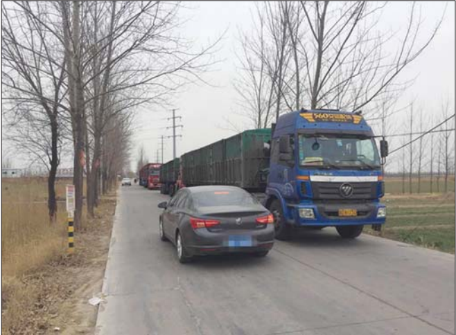
查扣的超载“百吨王”。

上午10时许，民警赶到现场后，发现五辆车均为河北重型半挂牵引车，车厢内装有钢材，车停在路边，驾驶员均锁门走人，不知去向。无奈之下，大队找来开锁公司将车门打开，随后，驾驶员陆续到达现场，在和民警僵持