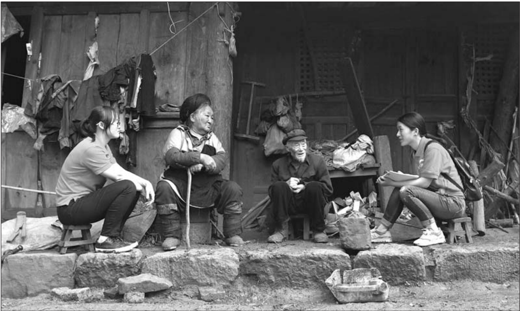
扶贫队员走访贫困户。

去年底,中央经济工作会议明确提出了三大攻坚战,其中“精准脱贫”赫然在列。这标志着未来三年,扶贫攻坚将成为中国的头等大事之一。恒大集团就闯出了精准扶贫的新路径,从2015年12月开始,已累计向贵州省扶贫基金会捐赠到位60亿元资金,并派驻两千余人的优秀扶贫团队到扶贫一线。