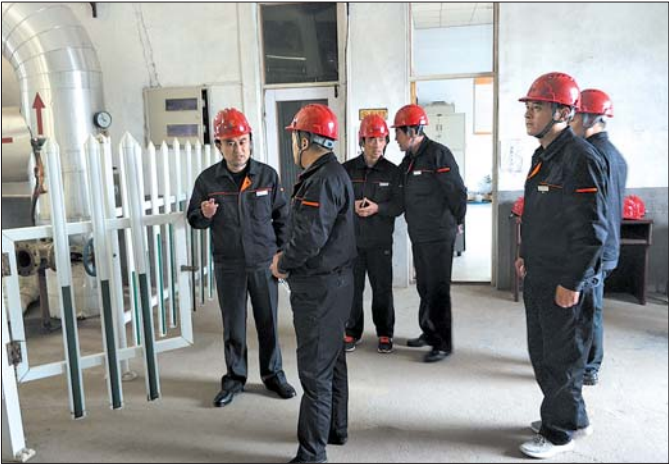
每日抽检设备,牢筑安全防线。

为保证设施设备运行良好,该公司不断加强对设施设备管网的消缺和维护保养。尤其是新班子上任以来,对公司所属管网、换热器、阀门、除污器、电气设备等存在的缺陷进行了全面统计,制定了详细的消缺计划,并按计划在不影响